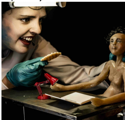
De mens aan het werk.