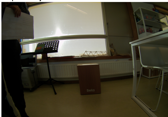
We hebben een cajon in elkaar geknutseld... Boem tsjak!