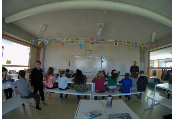
Hoofdstuk II: Leven op het eiland