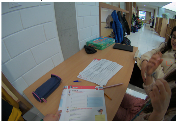
Werken, werken ... en nog eens werken!